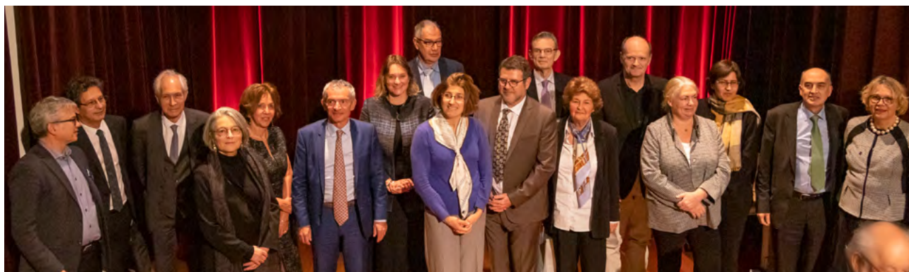
Cérémonie de réception des nouveaux élus – 11 février 2020, Paris, Maison de la chimie.