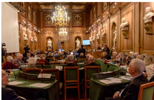
Scéance publique à l'Académie des sciences

Dans un texte rendu public le 9 avril, l'Académie des sciences, l'Académie nationale de médecine et l'Académie des technologies appellent à une vigilance raisonnée sur les technologies numériques.