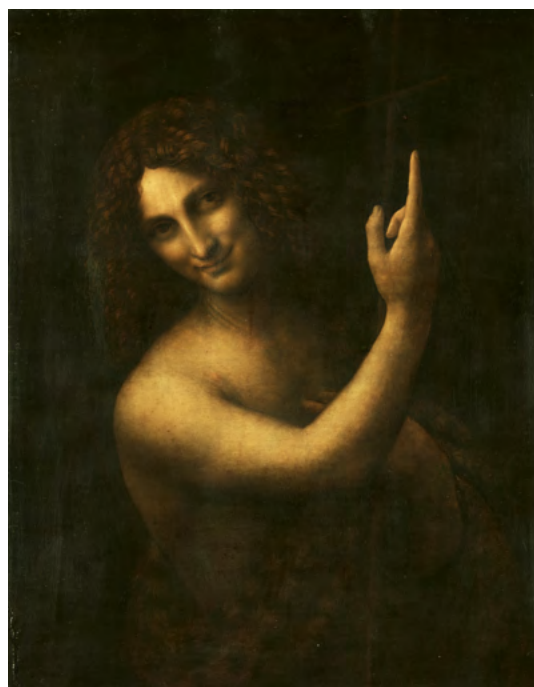
Léonard de Vinci, Saint Jean Baptiste : un faisceau d'analyse et d'examen a permis un allègement de vernis, une restauration conduite au C2RMF avec le département des Peintures du musée du Louvre.