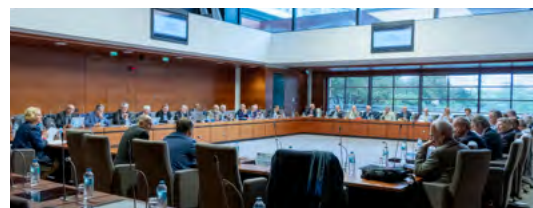
Séance à l'Hôtel de Région de Lille

La logistique souffre d'une image négative. Elle a pourtant connu une mutation technologique d'ampleur depuis les années 1990, qui s'est fortement accélérée dans les vingt dernières années. Cette séance aborde la reconfiguration et l'expansion du secteur logistique, ainsi que son impact social et environnemental.